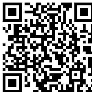
2023届毕业生情况统计表